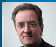
Jean-Raymond LEPINAY Saint-Gaudens