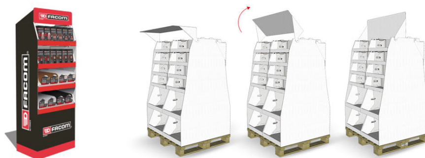
Figure 5 : Exemples de conditionnement « prêt à vendre »

Une des forces du groupe est la création des concepts de « prêt à vendre ». Cela consiste à proposer à nos clients des conditionnements spécifiques pouvant être directement mis en vente et mettant en valeur nos produits.