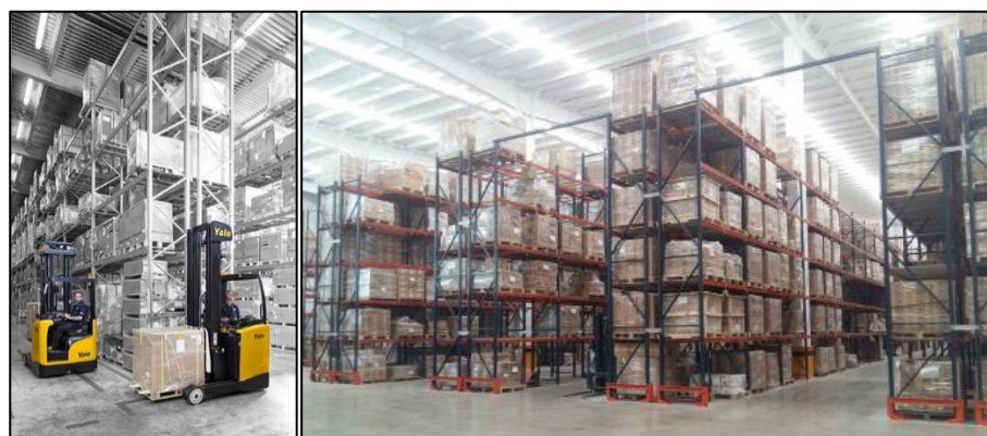
Figure 3 : Entrepôts de stockage

Cargo dispose à l'heure actuelle de 227 000 m 3 de capacité de stockage principalement en stockage en rack traditionnel. Les entrées ou sorties de stock sont réalisées grâce à des engins de magasinage comme ceux qu'on peut voir ci-dessous.