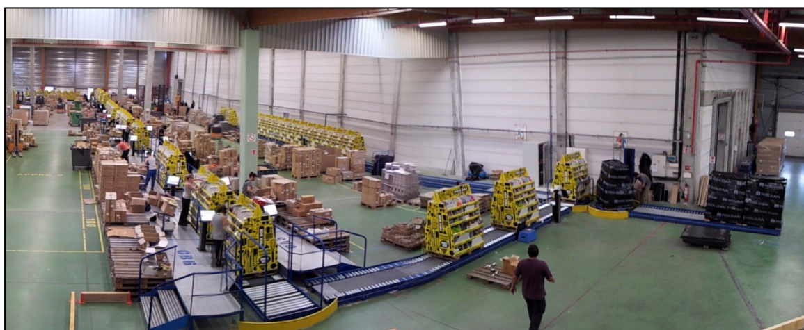
Figure 7 : Opération de remplissage de box