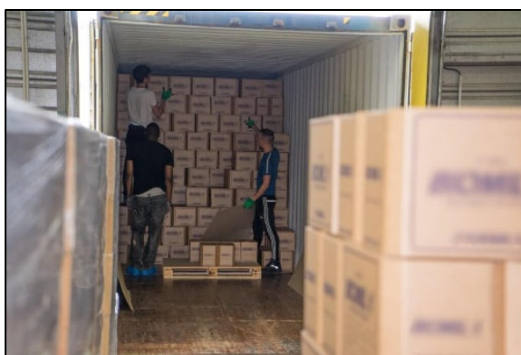
Figure 2 : Opération de dépotage d'un container

Chaque container est « dépoté » c'est à dire vidé des cartons pour être trié par référence et mis sur des palettes qui seront-elles même mises en stockage.