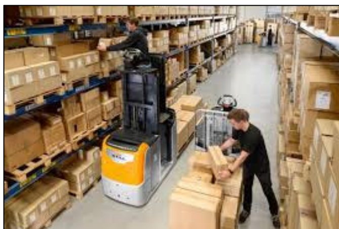
Figure 4 : Opération de préparation de commande

L'activité de préparation de commandes étant constituée essentiellement de manutentions, elle représente une activité professionnelle particulièrement pénible et accidentogène. Les conditions de travail exposent les préparateurs à un risque accru sur des pathologies telles que des lombalgies ou des tendinites. Ainsi, Cargo s'est engagé à améliorer les conditions de travail mais la nature même du process ne permettra jamais des conditions parfaitement satisfaisantes.